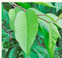
Les cerisiers (cerises douces) aucune nouvelle infestation