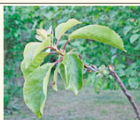
Les cerisiers (cerises acides) aucune nouvelle infestation