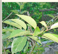
Les cerisiers (cerises douces) aucune nouvelle infestation