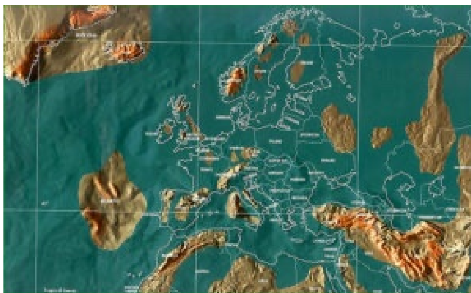
Carte de l'Europe après le cataclysme