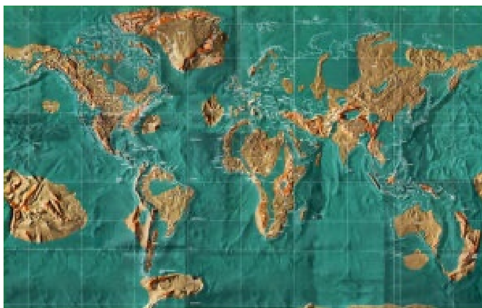
Carte du monde après le cataclysme

Si vous regardez les prédictions d'Edgar Cayce au fil des ans, alors, à partir du 21 e siècle, les catastrophes naturelles commenceront à secouer le monde. Petit à petit, sous les coups des éléments, les terres du nord de l'Europe, la moitié des USA, les îles japonaises vont passer sous l'eau ou disparaître. L'Afrique deviendra une terre de froid et de glace. Cette connaissance est venue au prophète lors d'un voyage dans le temps, qu'il a fait en 1902 dans l'un de ses États célèbres.