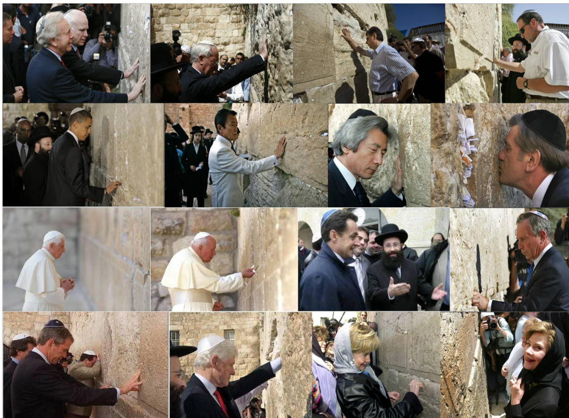
gauche - Les laquais des Rothschild prêtent serment d'allégeance) (À

Selon le rabbin Higger, dans la tradition juive