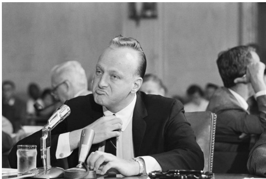
Frank Rosenthal interrogé pendant une audition de la sous-commission du Congrès en 1961