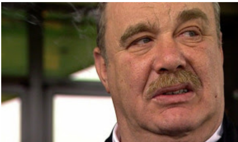
Semion Mogilevich est M. Big

M. Mogilevich est toujours le gangster le plus puissant du monde aujourd'hui et il ne figure plus sur la liste des plus recherchés du FBI.