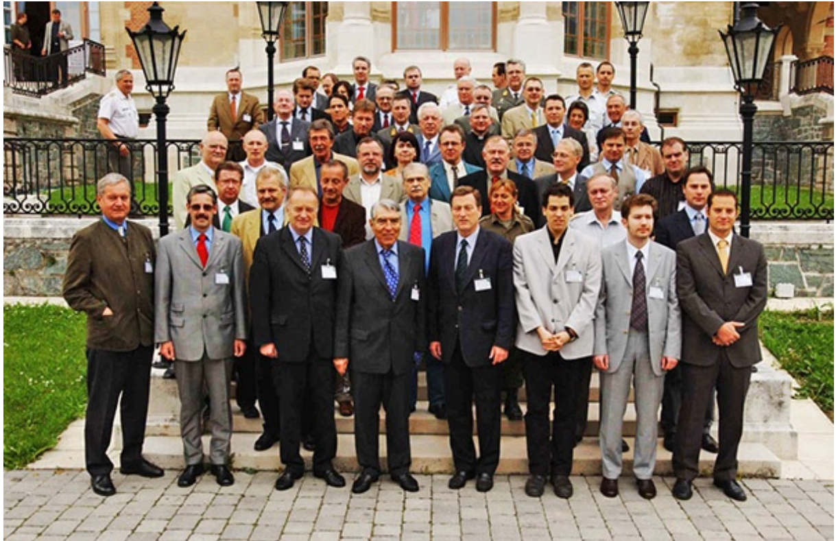
La Commission Rothschild