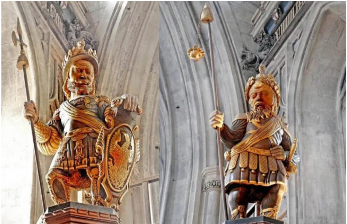
Gog et Magog de Londres.

Malheureusement, le MI-6 voulait faire exploser cette bombe nucléaire afin de donner plus de pouvoir à la mafia khazar en Angleterre - leur base dans le quartier financier de la City de Londres - car elle perd rapidement du pouvoir.