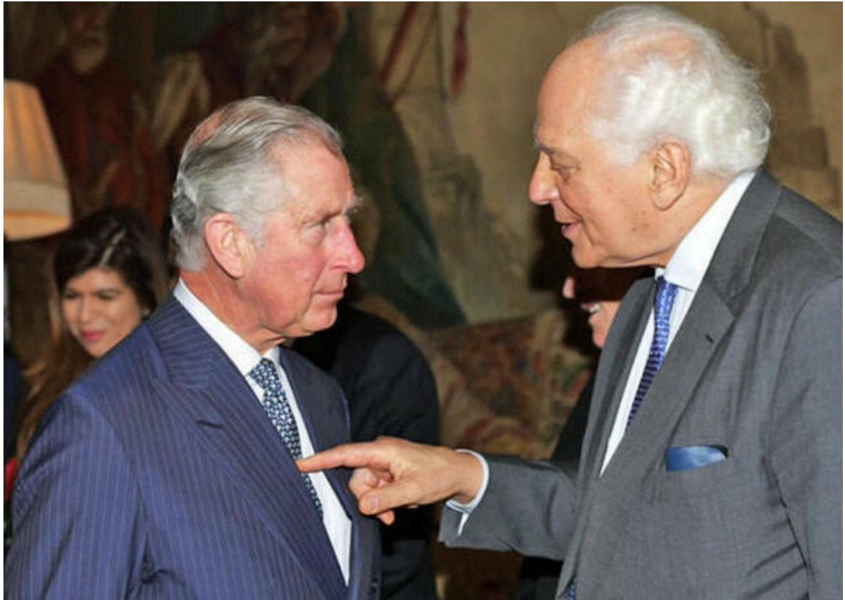
Evelyn de Rothschild enfonçant son doigt dans Le prince Charles ...

La Mafia Khazare (KM) décide d'infiltrer et de détourner toutes les banques mondiales en utilisant la magie noire babylonienne , également connue sous le nom de magie monétaire babylonienne ou l' art secret de gagner de l'argent à partir de rien en utilisant également le pouvoir de l'usure pernicieuse pour accumuler des intérêts :