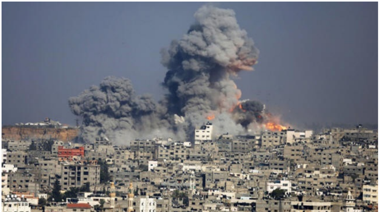
Bombardement israélien de la bande de Gaza.

Des recherches génétiques récentes évaluées par des pairs à l'Université Johns Hopkins et menées par un médecin juif respecté montrent que, 97,5 % des Juifs vivant en Israël n'ont absolument aucun ADN hébreu ancien , ne sont donc pas des Sémites et n'ont aucun lien de sang ancien avec la terre de Palestine... En revanche, 80 % des Palestiniens portent un ADN hébreu ancien et sont donc de véritables Sémites, et ont des liens de sang anciens avec la terre palestinienne.