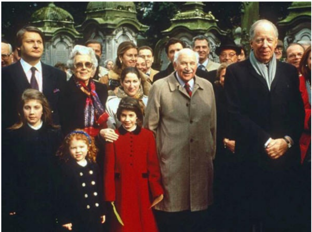
La famille Rothschild

Une fois la Seconde Guerre mondiale terminée, la Mafia khazare des Rothschild a déployé la guerre froide et l'a utilisée comme excuse pour faire venir des scientifiques nazis et des experts en contrôle mental en Amérique dans le cadre de l'opération Paperclip . Cela leur a permis de mettre en place un système mondial d'espionnage qui a dépassé de loin tous leurs efforts antérieurs. Dans le cadre de ce nouveau système, ils continuent d'infiltrer et de détourner toutes les institutions américaines, y compris les différents systèmes religieux américains, la franc-maçonnerie (en particulier le rite écossais et le rite d'York), l'armée américaine, les services de renseignement américains et la plupart des entrepreneurs privés de la défense, le pouvoir judiciaire et la plupart des agences du gouvernement américain, y compris la plupart des gouvernements des États, ainsi que les deux principaux partis politiques.