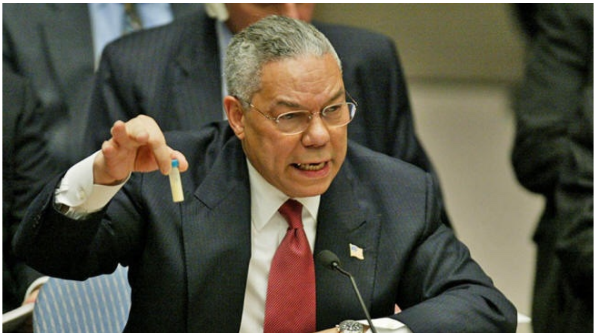
Colin Powell tient une fiole de Canular autour des armes de destruction massive en Irak ...