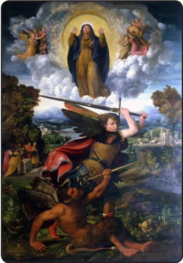
Dosso Dossi, L'archange Saint Michel terrassant le Démon , 1523 (Galleria Nazionale, Parme)