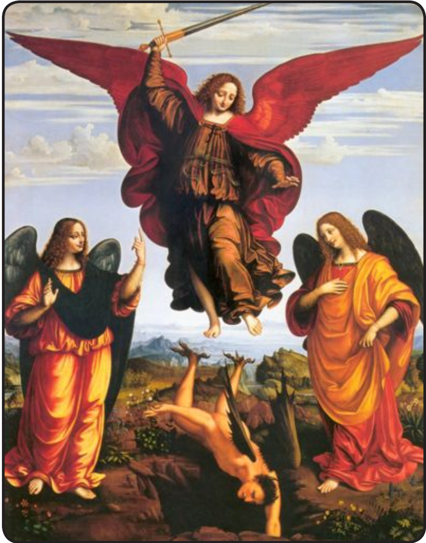
sub tutela michaëlis