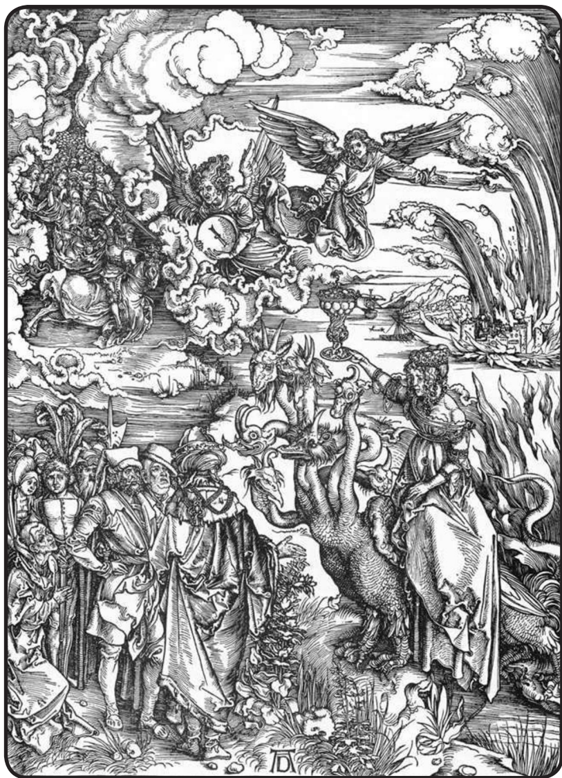
La Grande Prostituée de Babylone – Apocalypse, pl. 13 DURER Albrecht