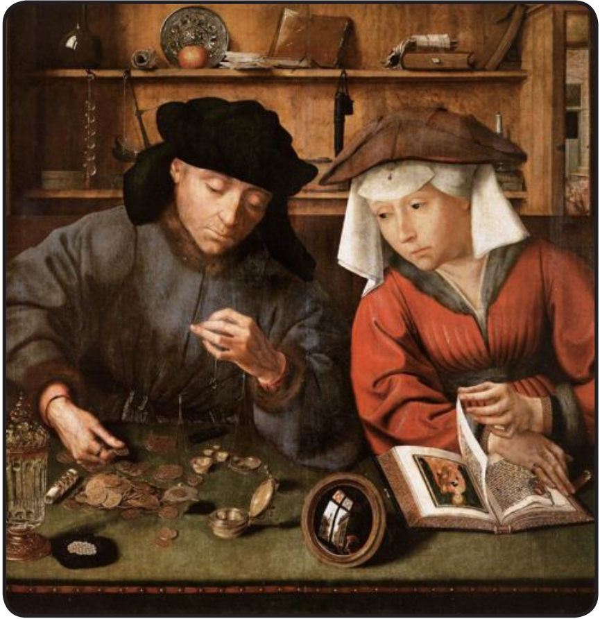
Quentin Massys, L'usurier et sa femme (1514) Huile sur panneau, 71 x 68 cm Musée du Louvre, Paris.