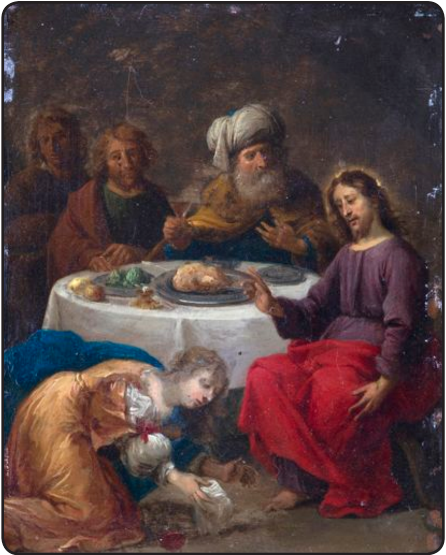
Le repas chez Simon le Pharisien, La prédication du Christ aux apôtres

ÉCOLE VÉNITIENNE, vers 1700. paire d'huiles sur cuivre (22.5 x 17.5 cm).