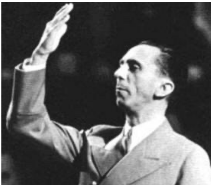
(Meyer Lansky de gauche ? Non, Josef Goebbels)